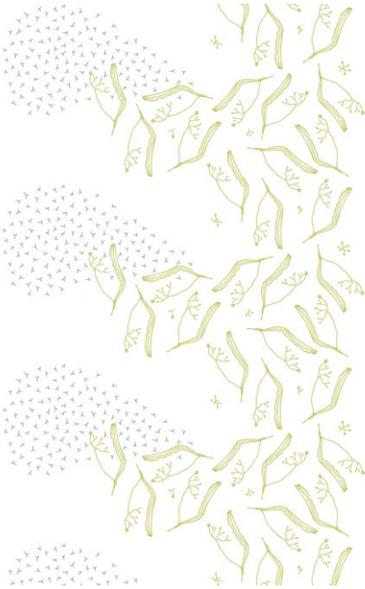
L499 + 111

The design can be printed with individually chosen colors, by utilizing for example Pantone-, NCS- or Tikkurila Symphony color charts. To ease and to guide the color design, we have composed a few standard color combinations. Standard print colors are chosen and named by Tikkurila Symphony color chart codes.