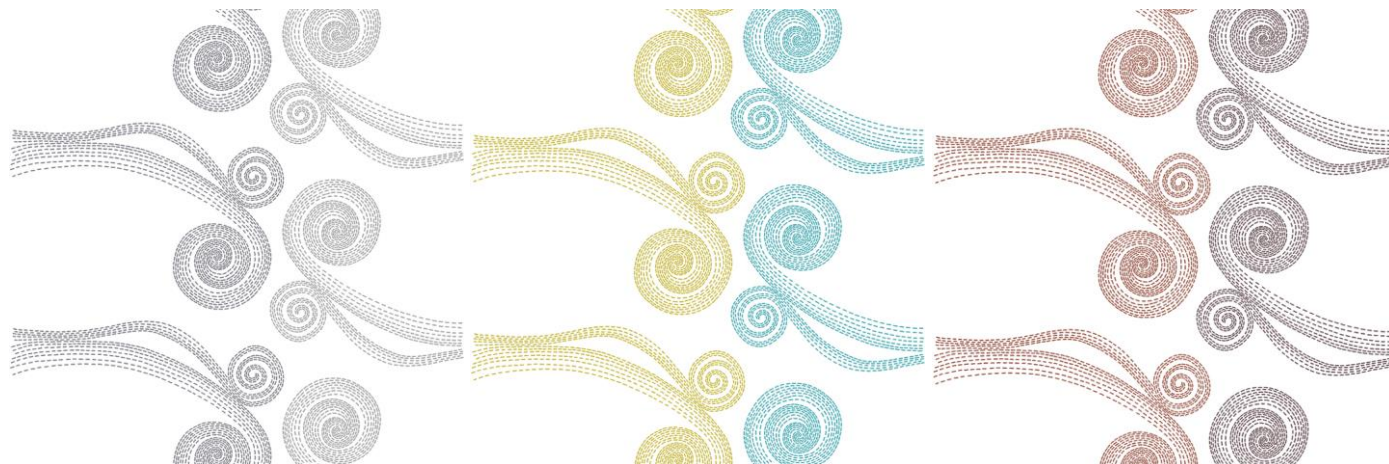
S500 + L500

The design can be printed with individually chosen colors, by utilizing for example Pantone-, NCS- or Tikkurila Symphony color charts. To ease and to guide the color design, we have composed a few standard color combinations. Standard print colors are chosen and named by Tikkurila Symphony color chart codes.