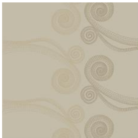
X457 + V457