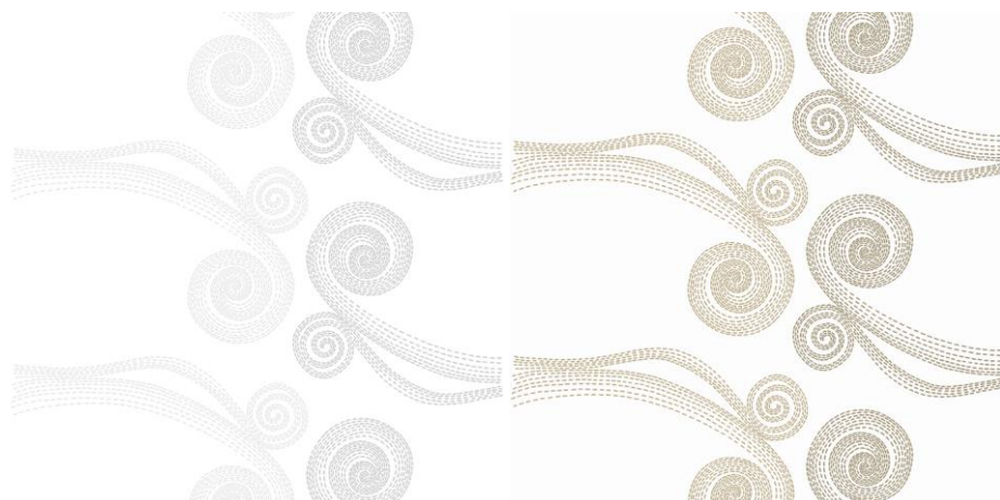
G499 + J499